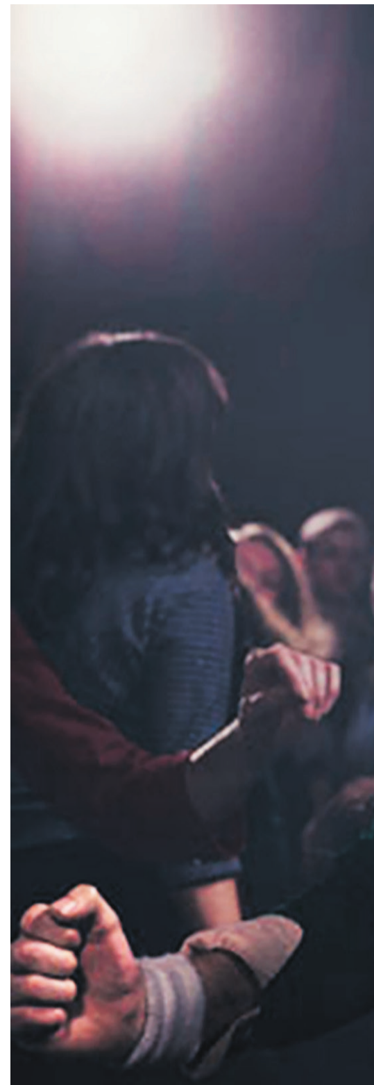
Northern Soul var en musik- och danskultur, med ursprung